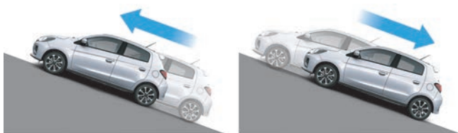
With Hill Start Assist Cu asistență la pornirea din rampă